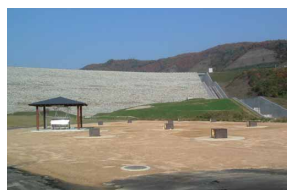
③ バーベキュー広場

野外でバーベキューを楽しめる施設。自然に囲まれながら、楽しい仲間とおいしいひとときを。