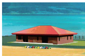
③ 水没した小学校をモチーフにしたトイレ

目の前に広がるダム湖の豊かな自然に囲まれながら、スポーツやピクニックを楽しめます。