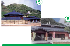
⑤ もにわの湯 ⑥ 茂庭ふるさと館

もにわの湯は、旅人の笠をイメージした屋根の下、自然石を使用した露天風呂は開放感たっぷり。茂庭ふるさと館では、打ちたての十割そばの味を楽しめます。